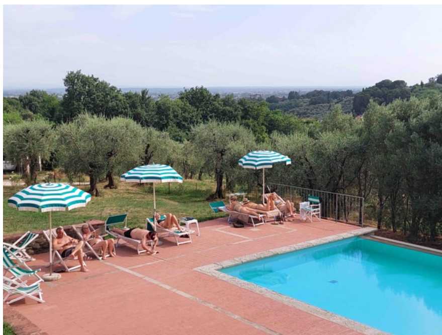
Eftermiddags-afslapning ved poolen