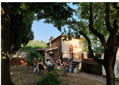
Hygge ved pizza-ovnen

– og det er skønt at fornemme jer aktionærers glæde over at være her! For rigtig mange har det været første besøg nogensinde, og jeres begejstring over Villaen og dens muligheder er fantastisk at mærke og gør os alle glade!