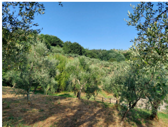
Udsigt over vores oliventræer

Gøre MIS til en del af det lokale miljø.