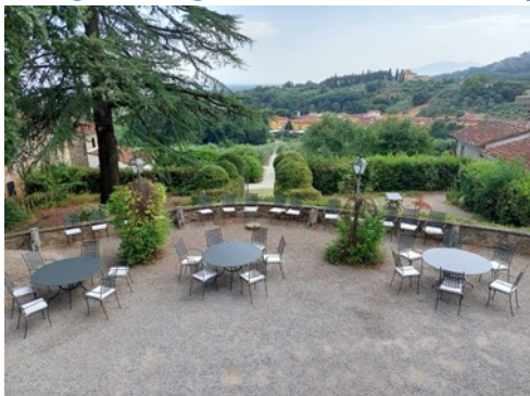
Vores nye havemøbler

Så er de sidste møbler og lamper vi bestilte til Villaen og Pisa ved at være på plads. Vi må dog vente med at tage stuerne i brug til efteråret, da der indlægges varme i villaen i løbet af denne sommer.