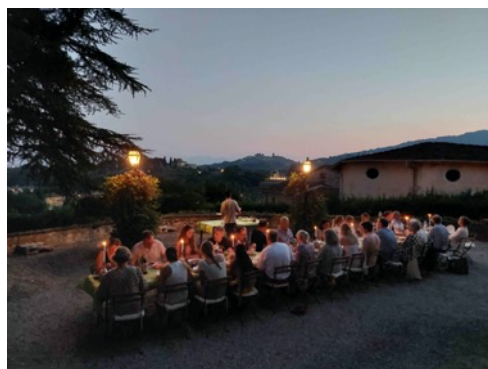
Fællesspisning foran Villaen

Der var stor begejstring blandt deltagerne for initiativet, arrangementet og maden - så konklusionen er, at vi vil bestræbe os på at fællesspisninger bliver en fast del af livet på Villa Vangile! – ikke mindst ser vi frem til at det store fællesskøkken i Villaen kommer til live under renoveringen af Lucca, så der vil være endnu bedre muligheder for de kulinariske oplevelser.