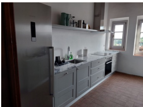
Det nye køkken i Pisa

I Villaen er vi nu ved at forberede indretningen af værelserne på 1. salen, som er ved at blive renoveret. Bl.a. blev vægfarverne og indretningen af badeværelserne bestemt under arbejdsugen.